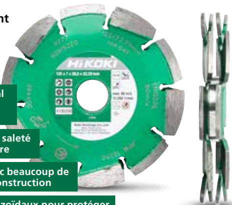
Disque diamant lame Triple Ø 125 mm 4100299