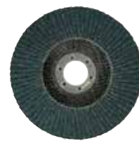
Disque à lamelles pour inox et métal 40/60/80/120 Ø 115 mm et Ø 125 mm