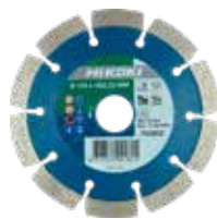
Disque diamant béton Ø 115 mm 752851 Ø 125 mm 752852