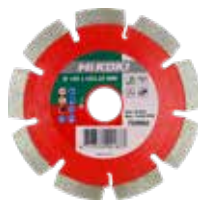
Disque diamant segmenté pour matériaux tendres et abrasifs Ø 115 mm 752861 Ø 125 mm 752862