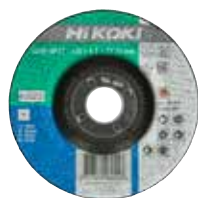
Disque de meulage métal 6 mm Ø 115 mm 4100231 Ø 125 mm 4100232