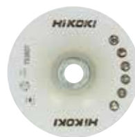
Support pour plateaux plastiques semi-rigides Ø 115 et 125 mm