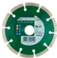
Disque diamant universel Ø 115 mm 752801 Ø 125 mm 752802

Équipez vos meuleuses avec nos accessoires de qualité. Nous proposons plusieurs disques pour toutes les applications et tous les matériaux. De cette façon, nous répondons aux besoins et aux exigences de chaque utilisateur. Pour un confort et un contrôle total, optez pour la poignée latérale anti-vibration.