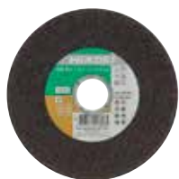
Disque à tronçonner pour inox et métal 1 mm Ø 115 mm 782301 Ø 125 mm 782302