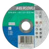
Disque à tronçonner métal 2.5 mm Ø 115 mm 4100201 Ø 125 mm 4100202