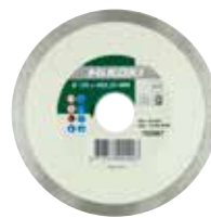
Disque diamant pour carrelage et pierre Ø 110 mm 752886 Ø 125 mm 752887