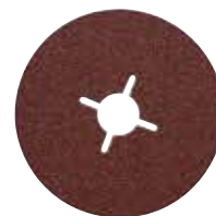
Disque abrasif pour utilisation avec plateau 24/36/60/80/120 Ø 115 mm et Ø 125 mm